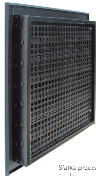
Siatka przeciw insektom