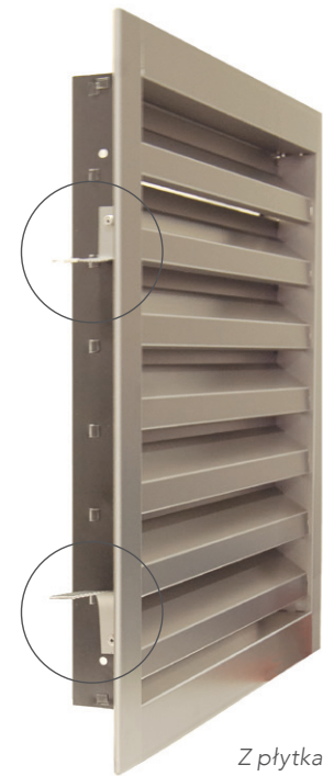
Z płytkami do zamocowania pomiędzy cegłami